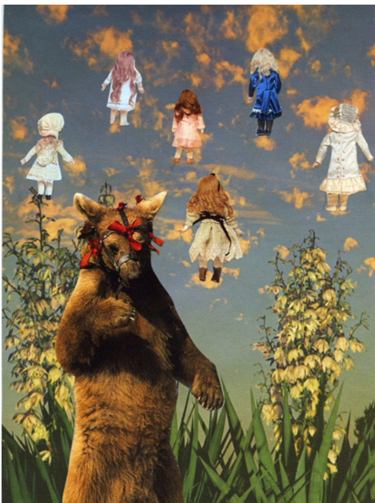
Marnie Weber, Clouds, 2012. Collages sur papier, 28,2x21,2cm. Courtesy galerie Praz-Delavallade, Paris © Marnie Weber et galerie Praz-Delavallade, Paris

Le conte de fées est le récit du merveilleux par excellence. Dans un récit merveilleux, l'histoire se déroule dans un temps passé indéterminé. Le merveilleux réside en grande partie dans la présence de personnages surnaturels et d'objets magiques. Le conte merveilleux est coupé du réel, le fabuleux ne s'y trouve ni expliqué, ni rationalisé, car le merveilleux reste une belle énigme et c'est peut-être là son sens premier : donner à réfléchir et donner à rêver. En effet, le propre du conte est d'inviter à la projection, et ce en raison de son potentiel métaphorique et sa proximité des mythes. Le lecteur est naturellement enclin à chercher un message dans le conte, à y projeter sa propre réalité. Les oeuvres de Marnie Weber adoptent ainsi l'esthétique des contes de fées, l'artiste y développant des mises en relation du réel au féerique et des passages d'un monde à l'autre.