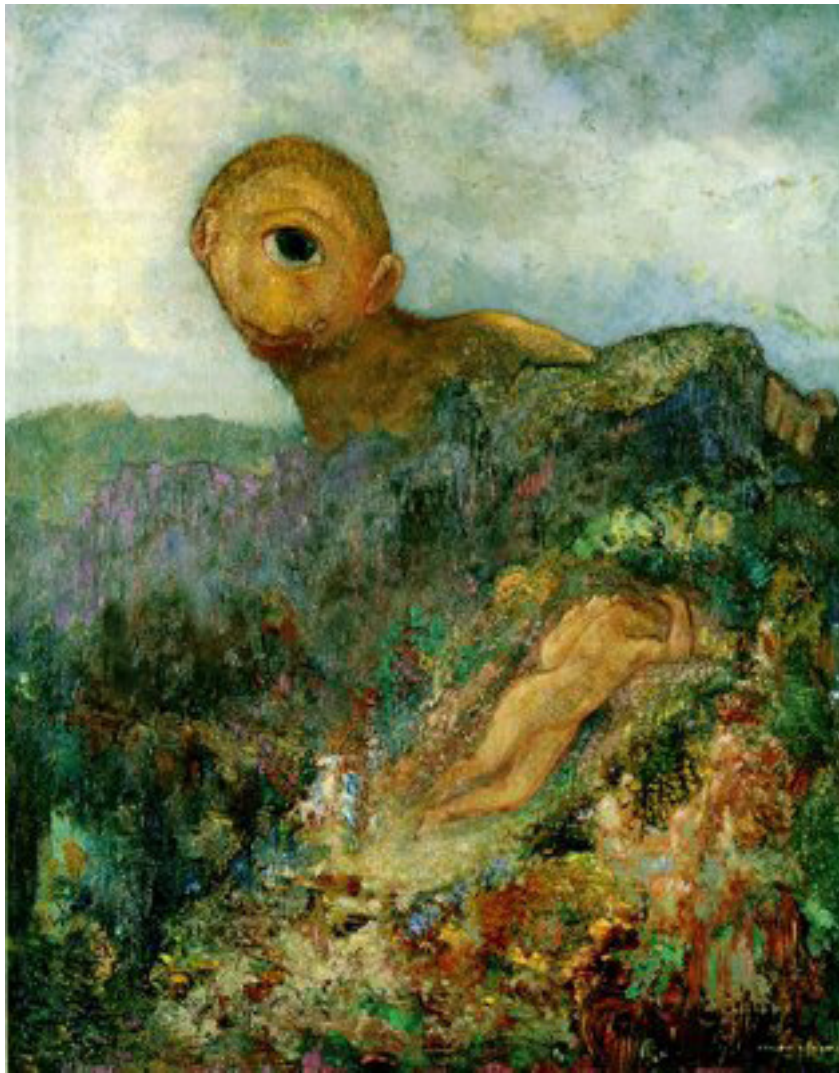
Odilon Redon, Le Cyclope , vers 1914, huile sur toile, 64 x 51cm

Le lieu merveilleux : le paysage qui sert de cadre à cette histoire tirée de la mythologie grecque s'éloigne de la figuration. C'est un espace sans profondeur ni formes véritablement identifiables. Les taches de couleurs vives et variées (contraste de complémentaires : rouge/vert, orange/bleu, violet/jaune), les jeux de textures fluides ou épaisses nous font basculer dans le surnaturel, merveilleux et tragique à la fois : Les taches rouges près de la nymphe suggèrent peut être la présence du corps mort d'Arcis, dont Galatée est amoureuse, et tué par le géant.