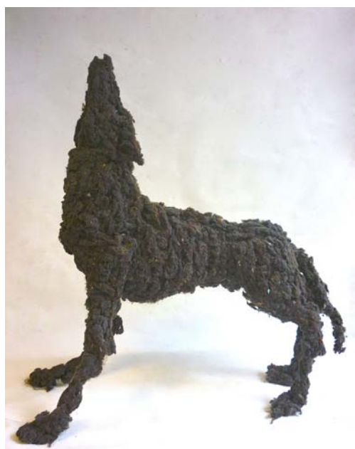
Marnie Weber, Clouds, 2012. Collages sur papier, 28,2x21,2cm. Courtesy galerie Praz-Delavallade, Paris © Marnie Weber et galerie Praz-Delavallade, Paris

Au château, dans le salon d'apparât, dans le boudoir, dans l'anti-chambre ou encore dans le couloir d'entrée, les élèves pourront découvrir des figures animales qui interrogent aussi bien nos peurs que notre fascination.