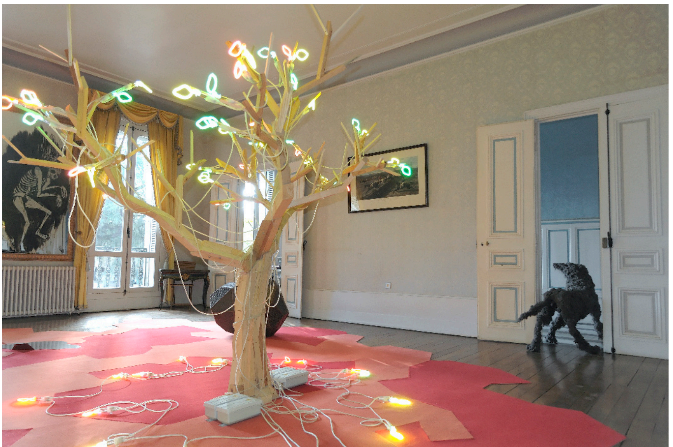
Vue générale de l'exposition «Au-delà du miroir» dans la salon d'apparat.