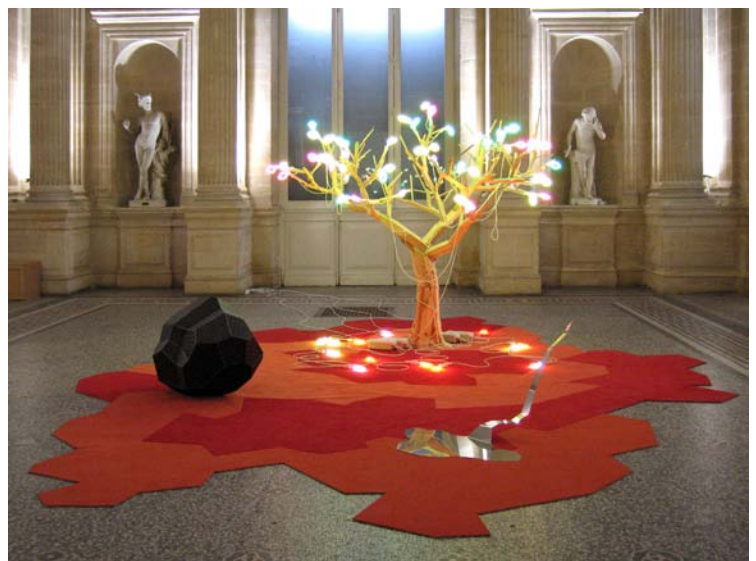
Pierre Malphettes, Un arbre, un rocher, une source , 2006. Bois, néon, câble électrique, transformateur haute-tension, tôle lamée, inox poli-recuit, moquette, 535 x 705 x 250 cm © Pierre Malphettes

>>> Les élèves pourront observer de quelle manière Pierre Malphettes utilise les câbles électriques et les «transfos» haute-tension de l'installation pour rajouter au mystère de ce paysage et à son caractère enchanté : les fils électriques enroulés autour des branches de l'arbre lui font un ornement qui le pare d'une certaine majesté telles les offrandes que l'on accroche aux arbres magiques dans certaines civilisations (tradition que l'on retrouve d'une certaine manière avec les arbres de Noël). L'aspect magique du rocher (élément phare du récit d'Arthur par exemple) se retrouve aussi dans la schématisation de la source qui apparaît tel l'éclair du glaive dans le lac magique (Excalibur, épée magique du roi Arthur, issue du rocher de la forêt de Brocéliande, a été jetée dans les eaux troubles et magiques du lac d'Avallon).