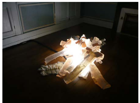
Myriam Mechita, Les incendies volontaires ou le fracas de la proie , 2013. Troncs en résine polyester, fils de cuivre, néons, étiquettes colipostage dactylographiées, livre noirci au noir de fumée, 7 cuillères en laiton avec cire et dents, peau de lapin, rossignol du Japon taxidermisé, perles de verre, chaîne dorée, clés, dessins au crayon sur papier, son. © Myriam Mechita et galerie Eva Hober, Paris. Production Le Parvis centre d'art. La création sonore a été réalisée en collaboration avec Léonard de Léonard.

>>> Ici encore, les élèves remarqueront que l'artiste a utilisé les particularités de la chambre pour la scénographie de son installation. Le bûcher est placé à même le sol, comme dans la réalité. Sauf qu'ici, le foyer est sur le plancher ce qui induit non seulement une situation de dangerosité extrême (c'est la maison entière qui va prendre feu et s'embraser ; on pense ici aux poltergeists des maisons hantées), mais aussi, inversement, un tour de magie, une performance d'illusionniste.