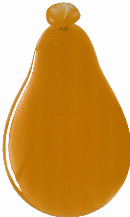
Sébastien Gouju, Ballons , 2002. Verre soufflé, 18x35 cm.

>>> Les élèves remarqueront que les deux oeuvres de Sébastien Gouju sont présentées de manière peu conventionnelle : les Boiteux sont posés à même le sol et les Ballons sont accrochés au plafond. Deux situations extrêmes pour des oeuvres sans socles.