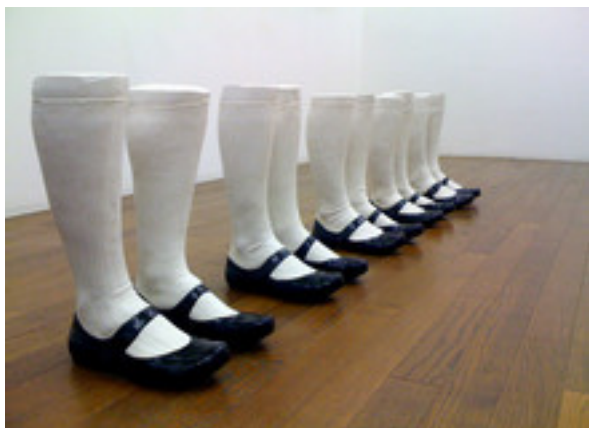
Sébastien Gouju, Les boiteux , 2010. Plâtre polyester peint, 40 x 8 x 150 cm. Courtesy Semiose galerie, Paris. © Sébastien Gouju et Sémiose galerie, Paris

Dans la chambre jaune du château, deux oeuvres de l'artiste Sébastien Gouju convoquent les mémoires de l'enfance. Dans cette pièce à la tapisserie fanée et au plancher en bois craquant, quelque chose de lointain appartenant à des sensations ressenties enfant lors d'un séjour ou d'un passage dans une vieille maison endormie et un peu inquiétante, se cristallise dans les oeuvres de l'artiste qui se plait à jouer avec les fantômes du passé. Sa démarche consiste à dire aux visiteurs : «dans ce que vous voyez, d'autres choses apparaissent. Une forme en appelle une autre. C'est une invitation à chercher dans les formes du quotidien d'autres formes inattendues.»