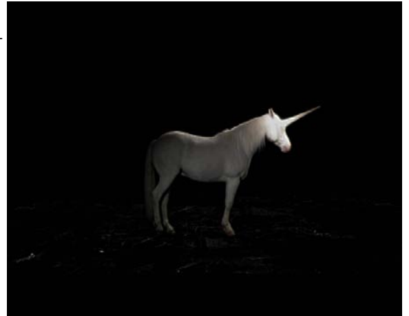
Maïder Fortuné, Licorne , 2007. Vidéo, digital Beta, couleur, sonore, 7' © Maïder Fortuné et Martine Aboucaya, Paris

Sur l'écran, une licorne vivement éclairée par une lumière blanche se tient immobile dans la nuit noire. Quelques notes de piano viennent ponctuer les légers mouvements de tête de la licorne. Cet animal de légende, symbole de puissance, exprime paradoxalement ici une très grande douceur et beaucoup de tristesse. Et lorsque la pluie arrive, la belle robe blanche s'efface et laisse place à un pelage gris, qui devient noir, faisant disparaître cette magnifique bête dans l'opacité de l'obscurité ambiante. La bête fabuleuse a laissé la place à un vieux cheval fatigué, destiné à l'abattoir, affublé d'une corne dérisoire faite de carton-pâte. Cette vidéo de Maïder Fortuné évoque la faillite de nos croyances, la désillusion et le retour inévitable au réel qui l'accompagne.